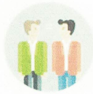
Добросовестность, равноправие и сотрудничество сторон