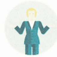
Нейтральность и независимость медиатора